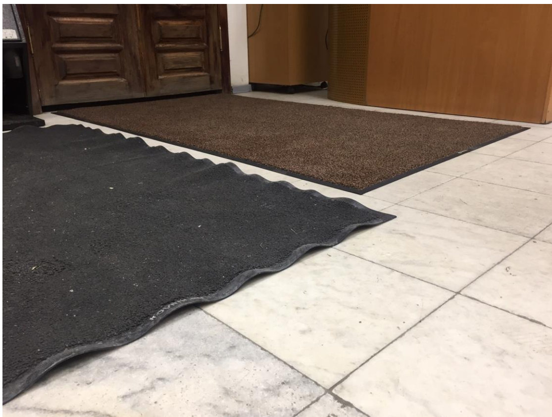
Сравнение – боковой кант