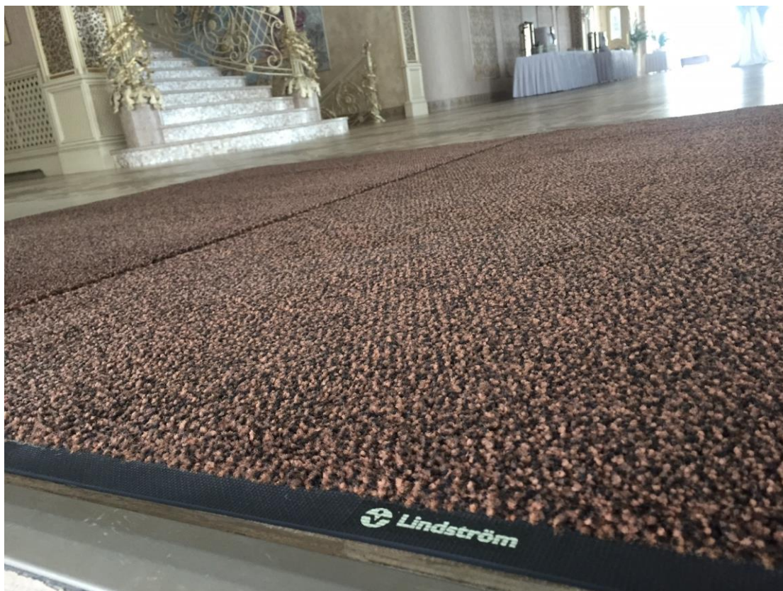
Фото - сравнение с коврами других контрагентов